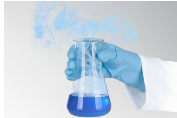
Tabelle der chemischen Beständigkeit